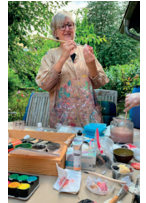
Mit Pinsel, Farbe, Styropor und Silikon entstanden die Wundmodelle in Handarbeit.

serkrankungen (offenes Bein), durch Wundliegen bei eingeschränkter Mobilität (Dekubitus) oder als Folgeerkrankung bei Diabetes (diabetischer Fuß). Neben intensiven Schulungen der Pflegenden, ist es Ziel des Wundmanagements, auch die betroffenen Patient*innen so zu beraten, dass sie ihre Wunden, z.B. den diabetischen Fuß, auch zu Hause gut versorgen können. Darüber hinaus engagiert sich das Wundmanagement im Wundnetzwerk Herne, wo es eng mit Pflegediensten und niedergelassenen Mediziner*innen zusammenarbeitet, um für die Patient*innen nach ihrer Entlassung aus dem EvK eine gute