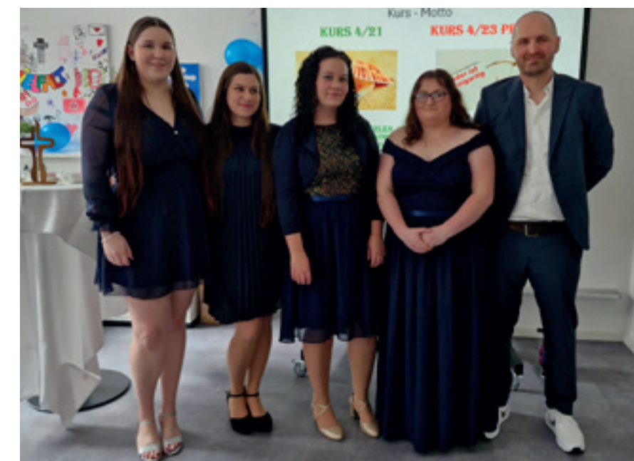
Die ersten Absolvent*innen der gemeinsamen Ausbildung von EvK und Pflegeschule Witten der Diakonie Ruhr

Wer eine Ausbildung in der Pflege absolvieren möchte, kann sich schon jetzt für Oktober bewerben. Weitere Informationen unter www.pflegefachschule-witten.de ◀