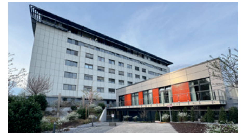
Mit seiner orangefarbenen Fassade setzt der Anbau freundliche Akzente.